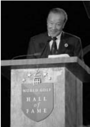
2004年殿堂入りした青木功のグリップ像が今回発売される