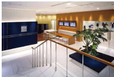
フィットネスクラブ「Le Club」