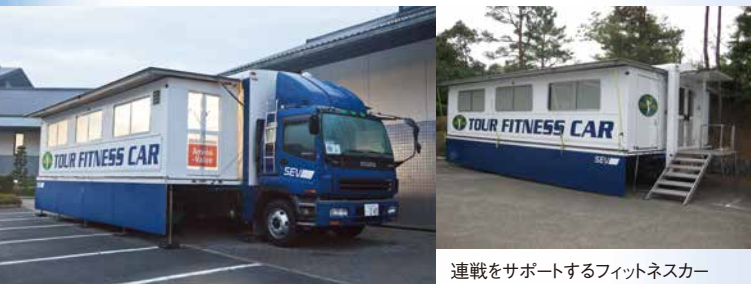
連戦をサポートするフィットネスクー

これからもプレジャーの最高の技術が、プロゴルファーの最高のパフォーマンスを生み出していく。