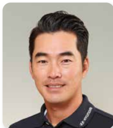
キム ヒョン ソン 金 亨 成 (プロゴルファー)

17歳からゴルフを始める。 2005年に韓国でプロ転向し3勝したあと2008年から日本ツアーに参戦。 日本プロゴルフ選手権などツアー4勝で、9年連続賞金シードを維持。 日本語も堪能で女性ファンが多い。