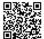
健康チェックシート

をメール( kidsgolf@jgto.jp ) 又は FAX( 06-6379-3583 )までご連絡ください